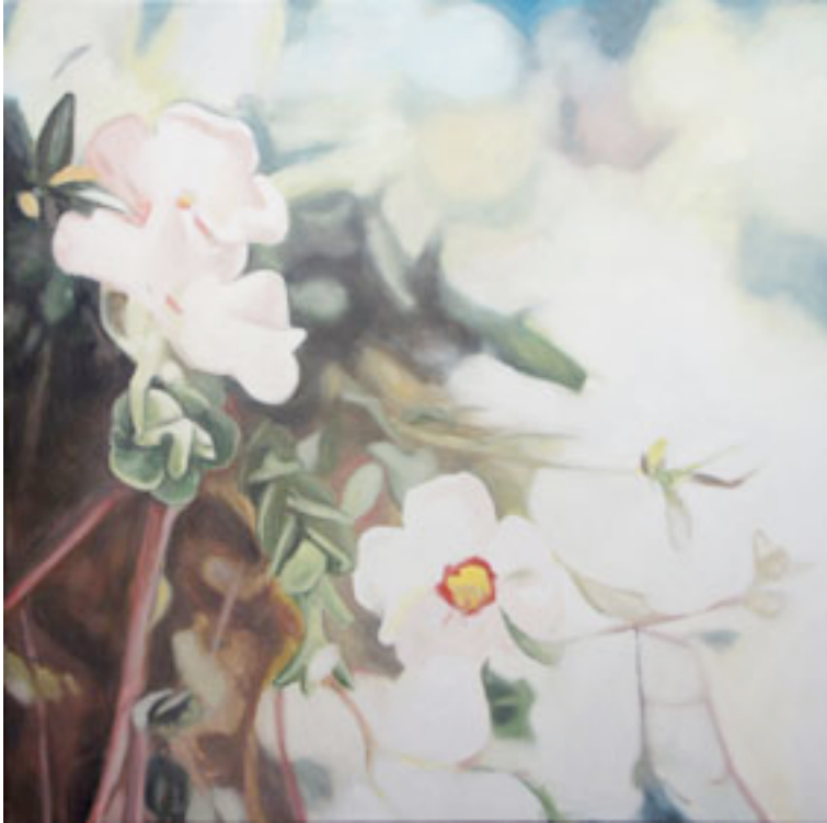
Paradis perdu , 2013. Huile sur toile 100 x 100 cm.