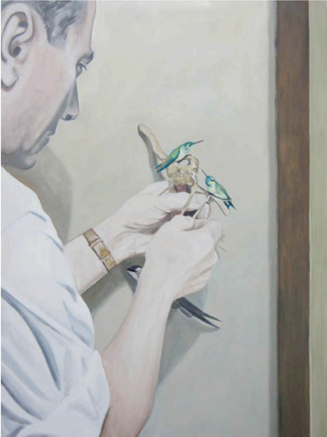
„ Fioretti „, 2013. Huile sur toile 120 x 150 cm.